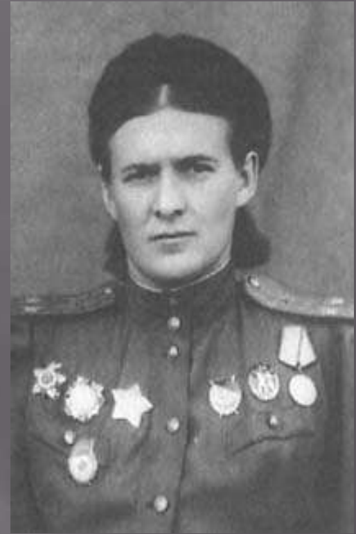
Евдокия Давыдовна Бершанская (Бочарова)