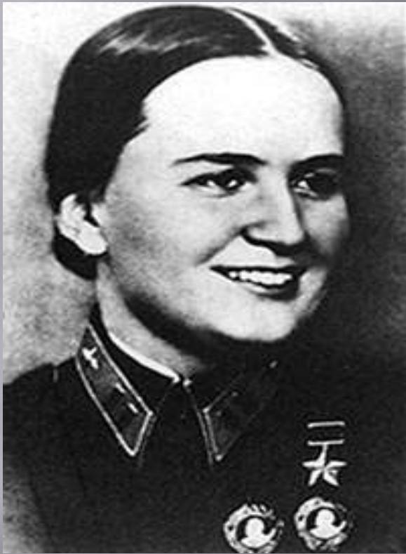
Герой Советского Союза майор М. М. Раскова